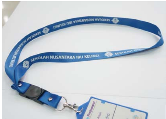
Paket ID Card