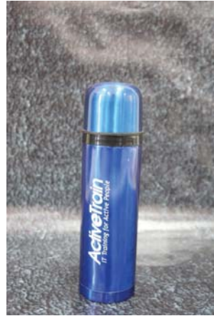
Sablon Souvenir Termos