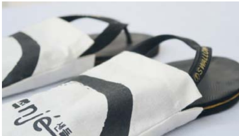
Souvenir Pouch Sandal