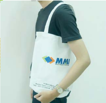
Goodie Bag PT. MMI