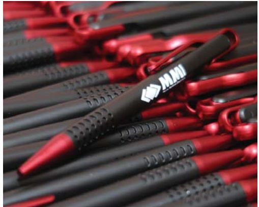
Pulpen PT. MMI